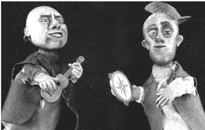
"Boy in a Barrel" hand puppets. UMASS Department of Theater 2004

La mano del titiritero esta adentro del titere y con ella manipula al titere. Arriba vemos dos modos de usar los dedos.